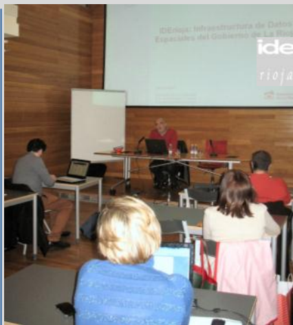
Taller sobre mapas en la Casa de los Periodistas

Se pone así de relieve el progresivo acceso de los ciudadanos a este tipo de herramientas hasta ahora reservadas a arquitectos, ingenieros y profesionales del entorno GIS. Hoy, cualquier usuario con acceso a internet puede configurar sencillamente sus propios mapas con información oficial y generar documentos e integrarlos en cualquier entorno: web, códigos QR, redes sociales , etc.