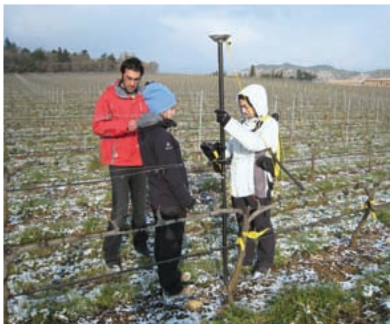
Foto 1. Levantamiento de los puntos de muestreo en el viñedo mediante un receptor Trimble 5700 (Trimble, California), y corregidos en tiempo real con la red GNSS de La Rioja.

Servicios disponibles a través de la web: http://www.iderioja.larioja.org/index.php?id=20&lang=es