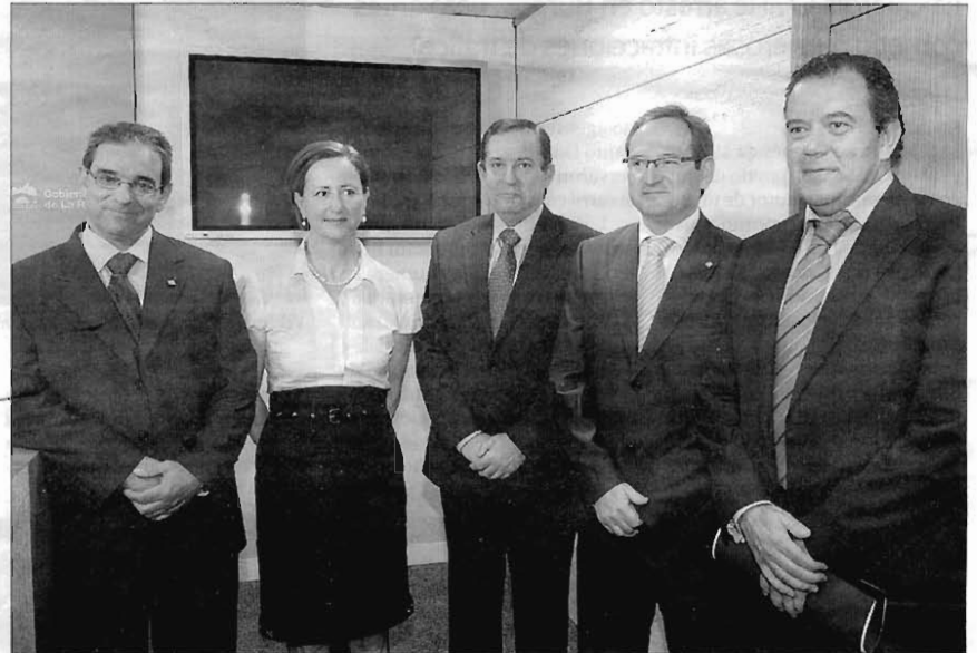
Miembros del Gobierno y de la Universidad de La Rioja explicaron ayer el acuerdo.

Además, impulsa «la innovación mediante el intercambio de conocimientos y tecnologías entre los agentes del Sistema Riojano