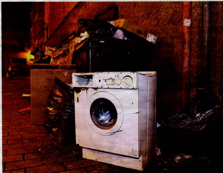
La ayuda se aplicará a la sustitución de aparatos como lavadoras o frigoríficos. NACHO TORRA

Los beneficiarios pueden ser personas físicas o jurídicas, de naturaleza pública o privada, que sustituyan electrodomésticos de los incluí-