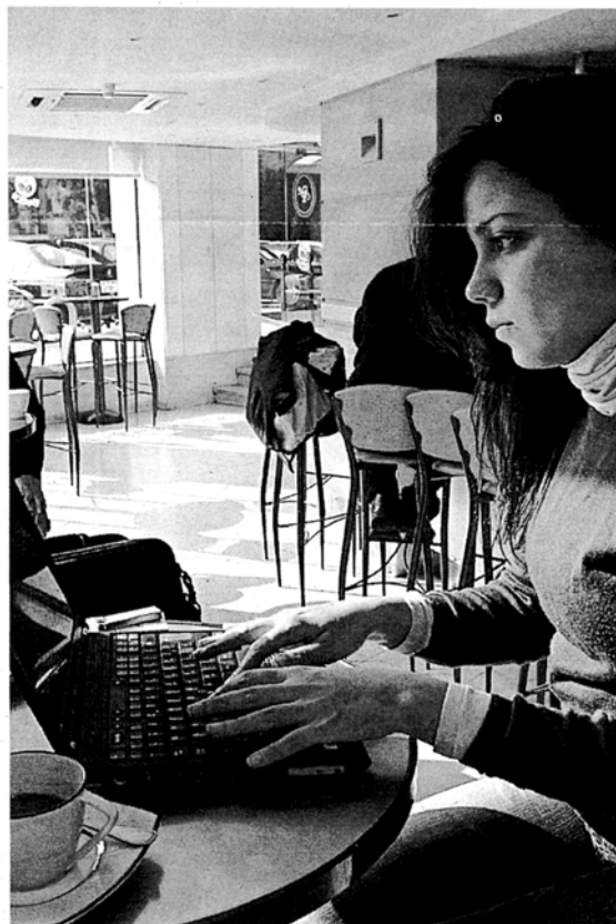
Una joven navega con su portátil en una cafetrería 'wifi'.

El portal Lycos.es ofrece un servicio para localizar wifi en cualquier parte