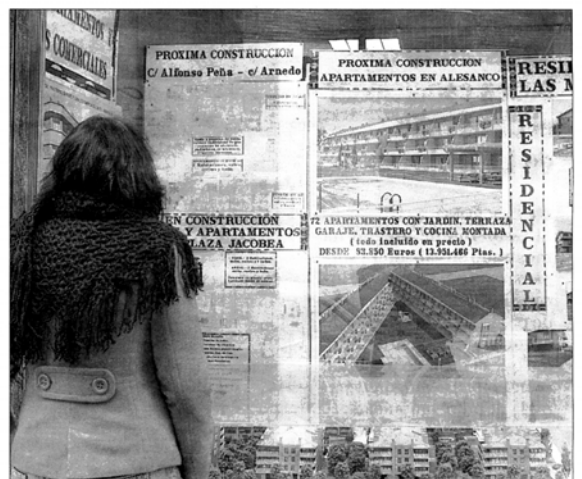
Una joven se interesa por una promoción de viviendas en una inmobiliaria.

El representante sindical recordó que, «con un 14,51 por ciento de paro juvenil, la tasa de empleo más baja del país junto a Ceuta y Melilla; un 51,69 por ciento de jóvenes trabajadores con contrato temporal y la extraordinarias dificultades que nos encontramos para acceder a una vivienda, siquiera en régimen de alquiler, convierten la emancipación en una misión casi titánica».