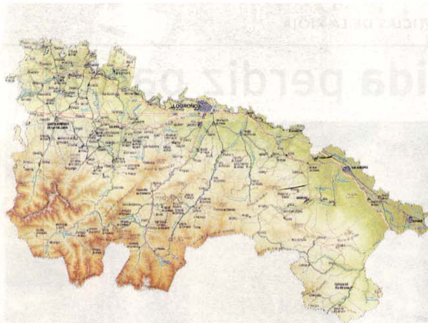
Mapa general de la Comunidad Autónoma de La Rioja. / NR