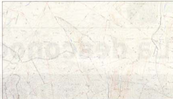
Relieve de la comarca de Santo Domingo de la Calzada.