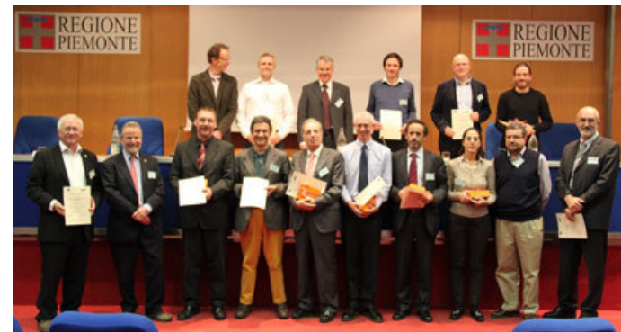
Przedstawiciele nagrodzonych Serwisów SDI po wręczeniu wyróżnień